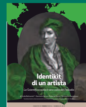
IDENTIKIT DI UN ARTISTA Febbraio 2017