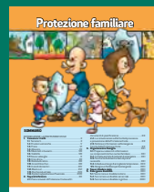
PROTEZIONE FAMILIARE Luglio 2017