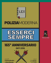
COMPENDIO DATI Aprile 2017