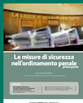
LE MISURE DI SICUREZZA NELL'ORDINAMENTO PENALE PRIMA PARTE Maggio 2017