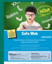
SAFE WEB PRIMA PARTE Agosto/settembre 2017