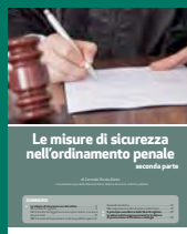
LE MISURE DI SICUREZZA NELL'ORDINAMENTO PENALE SECONDA PARTE Giugno 2017