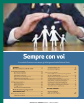
SEMPRE CON VOI Marzo 2017